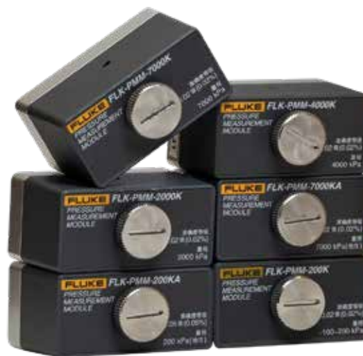
Figura 1. Batería de litio recargable con indicación de capacidad.

Comunicación HART que permite la calibración de salida de mA, de los valores aplicados y de presión 0 de los transmisores de presión HART. Puede cambiar fácilmente una etiqueta del transmisor, las unidades de medida y los rangos. Otros comandos HART compatibles incluyen la configuración de salidas de mA fijas para resolución de problemas y lectura de los parámetros de configuración del dispositivo y del diagnóstico.